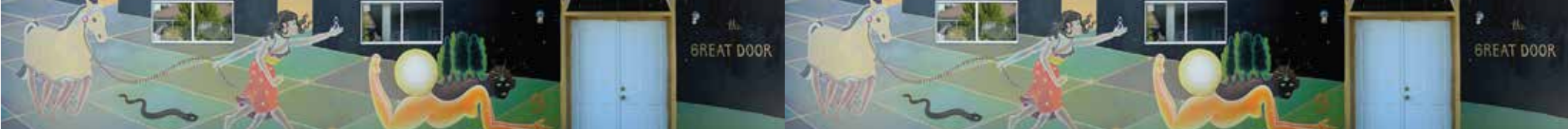
Mural de desplazamiento forzado interno. "The Great Door" Instituto Madre Assunta, Tijuana, Baja California.