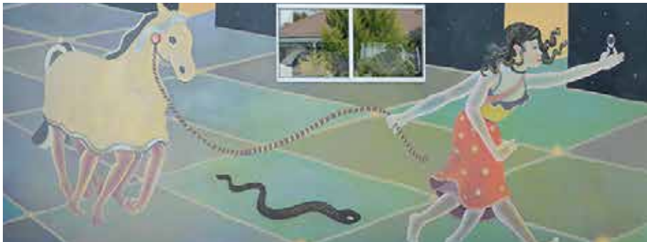
Mural de desplazamiento forzado interno. "The Great Door" Instituto Madre Assunta, Tijuana, Baja California.

El mural representa a las víctimas de desplazamiento forzado interno por violencia, con una manta o disfraz de caballo que oculta a las familias durante su tránsito. El caballo es guiado por una mujer que representa la esperanza de una vida mejor. El miedo acecha provocado por una serpiente negra que las acompaña durante el camino. La esperanza guía el recorrido de las víctimas hacia la puerta, "The great door", que simboliza el refugio o el asilo en otros países. Se puede apreciar un hada, que representa para las víctimas de desplazamiento la fragilidad de sus vidas.